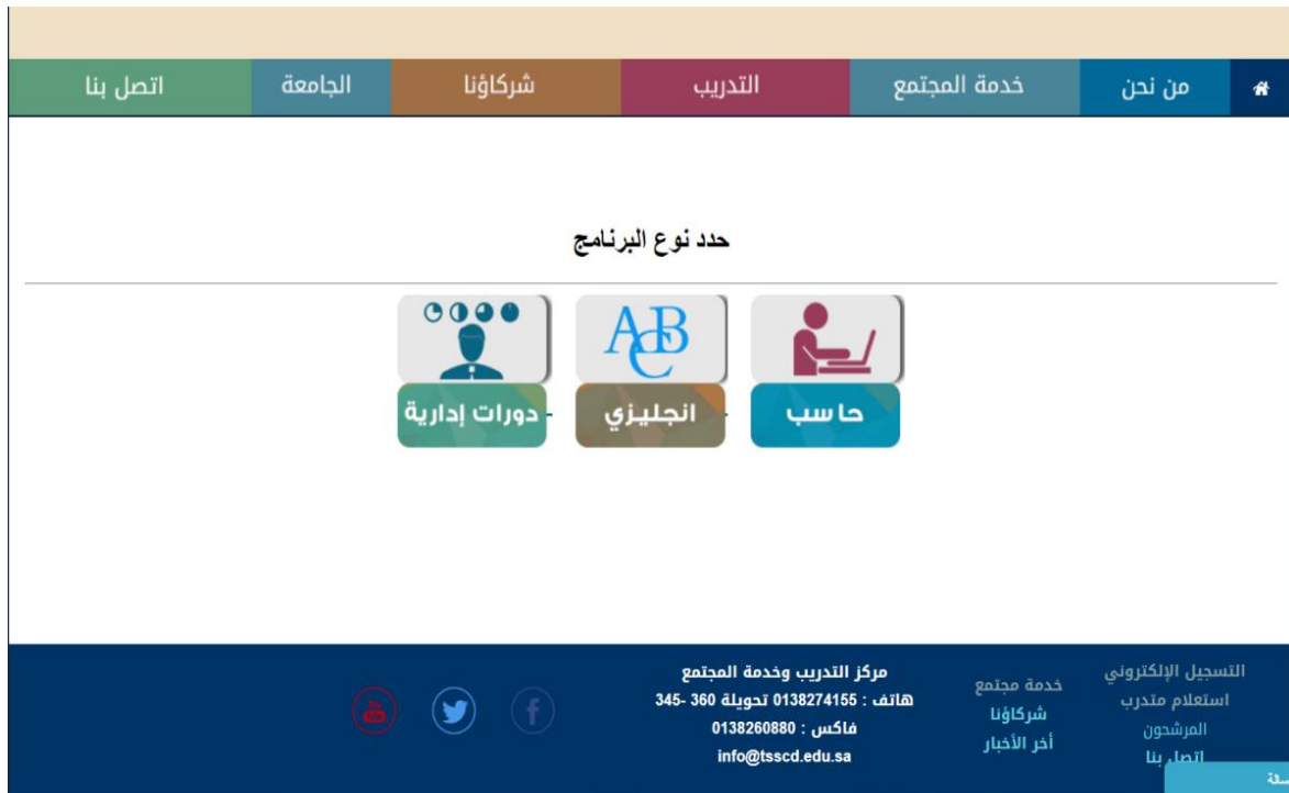
رسم توضيحي 4 : اختيار نوع البرنامج