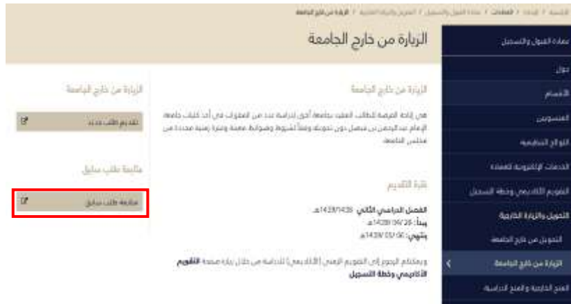
شاشة توضيحية: ٢٣ - الشاشة الرئيسية متابعة طلب سابق للزيارة الخارجية

٣. يتم ادخال معرف المستخدم ( رقم السجل المدني / الإقامة ) وكلمة المرور التي تم ادخالها عند انشاء الطلب .