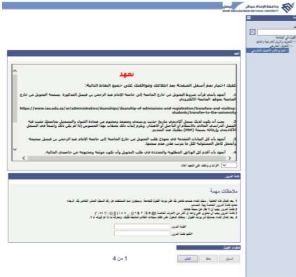
شاشة توضيحية: ٨- الشاشة الرئيسية لواجهة كلمة المرور في طلب التحويل الخارجي

٢. قراءة التعهد ثم اختيار (قرأت ووافقت على التعهد أعلاه) مع إدخال كلمة المرور.