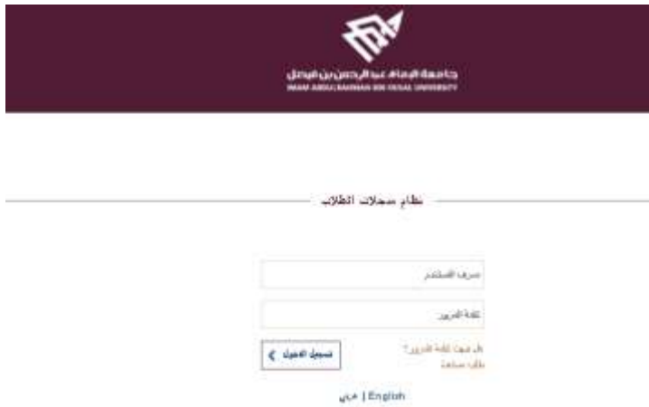
شاشة توضيحية: ٢٤ - الشاشة الرئيسية للدخول على صفحة متابعة طلب سابق على النظام

٣. يتم ادخال معرف المستخدم ( رقم السجل المدني / الإقامة ) وكلمة المرور التي تم ادخالها عند انشاء الطلب .