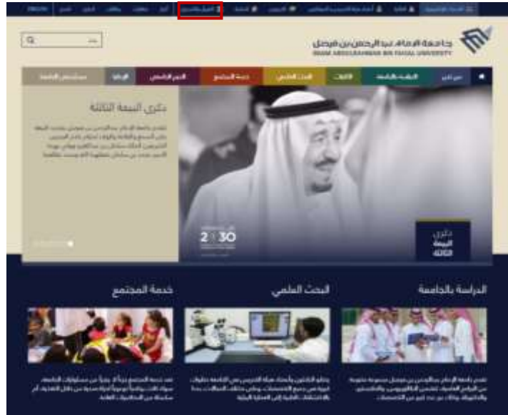
شاشة توضيحية: 1- الشاشة الرئيسية لموقع الجامعة

١- الدخول على موقع الجامعة ثم اختيار التحويل الخاص بعمادة القبول والتسجيل