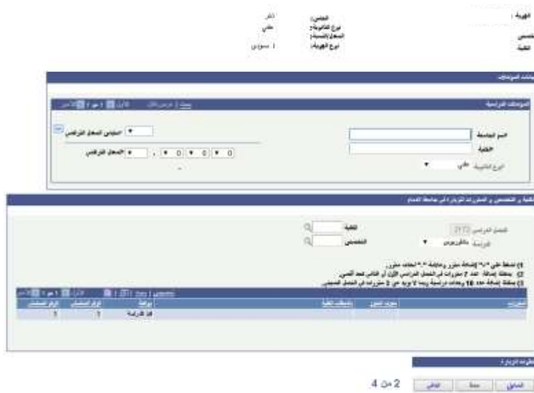
شاشة توضيحية: ١٥ - الشاشة الرئيسية لواجهة البيانات الأكاديمية

٣. الضغط على أيقونة (التالي) حتى يتم الانتقال إلى صفحة البيانات الأكاديمية لمقدم الطلب ( المعدل التراكمي - نوع الدراسة - قطاع الجامعة ) بالإضافة إلى ادخال الكلية التي يرغب بتقديم طلب الزيارة بها والتخصص لتظهر له قائمة بالمواد المتاحة للدراسة .