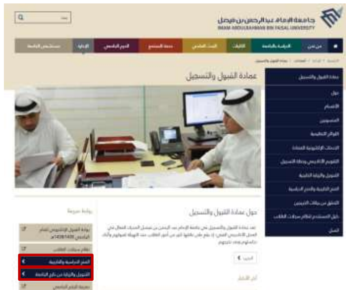
شاشة توضيحية: ٢- الشاشة الرئيسية لصفحة عمادة القبول والتسجيل

٢- اختيار ايقونة التحويل والزيارة من خارج الجامعة أو المنح الدراسية والخارجية .