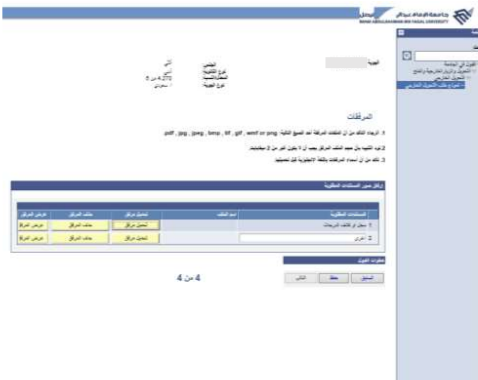
شاشة توضيحية: ١١- الشاشة الرئيسية لواجهة ارفاق المستندات