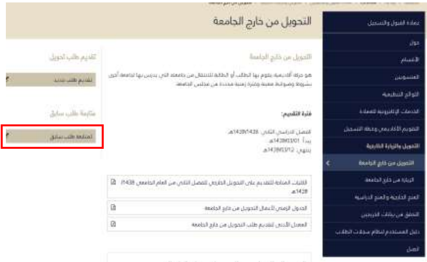
شاشة توضيحية: ٢٢ - الشاشة الرئيسية متابعة طلب سابق للتحويل الخارجي