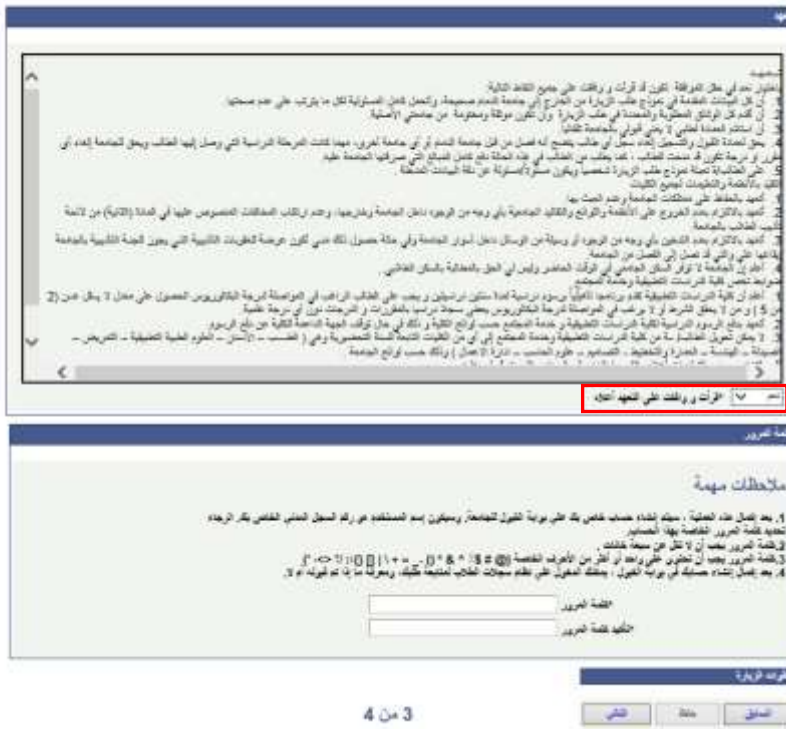
شاشة توضيحية: ١٦ - الشاشة الرئيسية لواجهة كلمة المرور في طلب الزيارة الخارجية

٤. قراءة التعهد ثم اختيار (قرأت ووافق على التعهد أعلاه ) مع إدخال كلمة المرور ثم الضغط على أيقونة ( التالي).