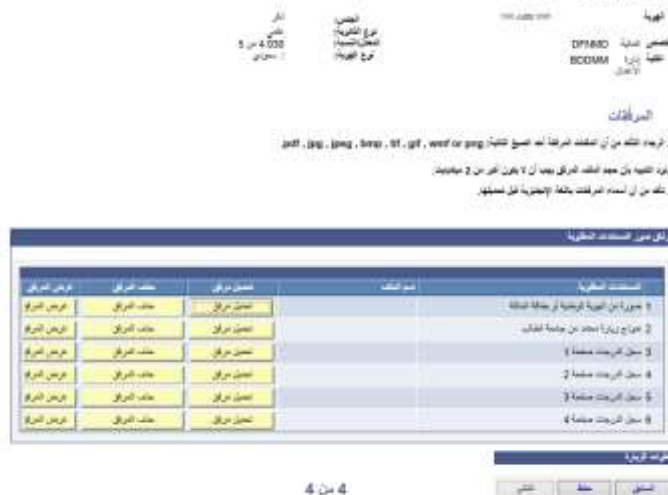
شاشة توضيحية: ١٧ - الشاشة الرئيسية لواجهة ارفاق المستندات

٥. ارفاق المستندات المطلوبة ( هوية مقدم الطلب - نموذج زيارة معتمد من جامعة الطالب - سجل او كشف الدرجات ) ثم الضغط على أيقونة ( حفظ ) ليكتمل الطلب.