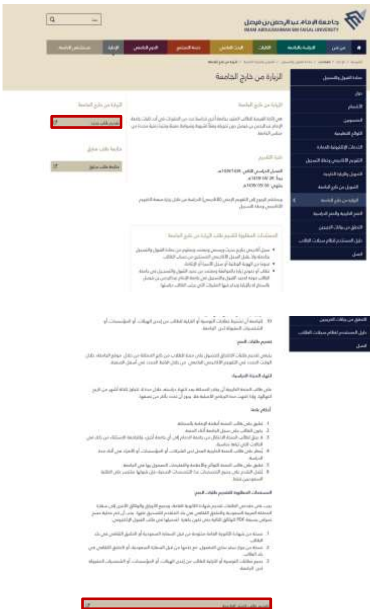
شاشة توضيحية: ٣- الشاشة الرئيسية لتقديم طلب جديد